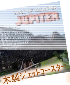
木製ジェットコースター